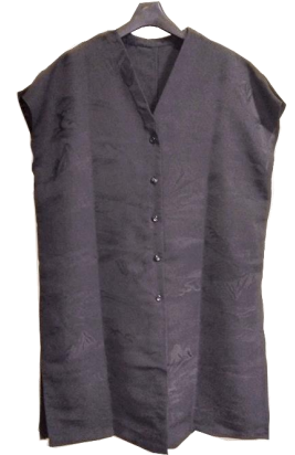
丹前の生地 ジャンパードレスとズボン