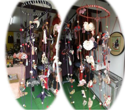
五月人形つりし飾り