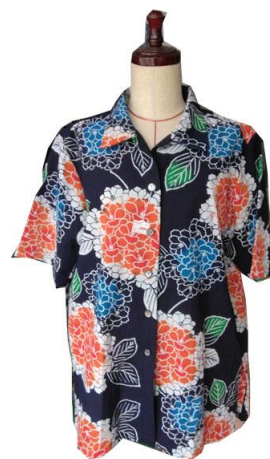
浴衣で作ったアロハシャツ